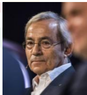
諾貝爾經濟學獎得主皮薩裡德斯 (Christopher A. Pissarides) 教授